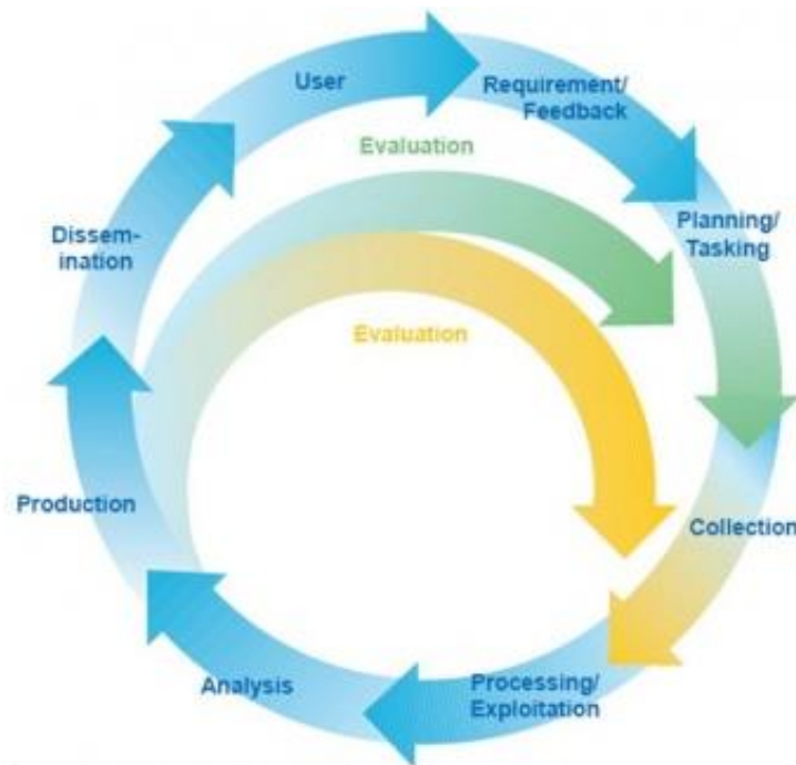
Figuur 1 De intelligence cycle 13

informatie, maar is niet alle informatie intelligence. " 10 De informatie waarover hier gesproken wordt dient onzekerheden weg te nemen of een informatievoorsprong te geven waardoor het degene die deze informatie gebruikt, ondersteunt bij het nemen van een bepaalde beslissing. Omdat niet alle informatie direct geschikt is voor deze gebruiker of decisionmaker 11 kan informatie pas aangemerkt worden als intelligence wanneer deze een zekere relevantie voor deze gebruiker en een mate van waarschijnlijkheid bevat. Daarnaast moet de informatie tijdig geleverd worden waardoor het maken van een beslissing mogelijk is. Een voorbeeld hiervan is het vermogen tot early warning ter waarschuwing van aanstaande dreigingen. 12