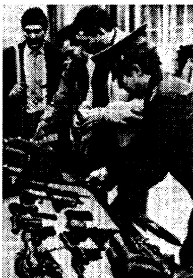
Inbeslagneming van illegale wapens

Uit andere bronnen werd bekend dat de stijging van de criminaliteit, met name in de Russische Republiek (RSFSR), groter is dan in de meeste andere delen van de Sovjet-Unie. Ongeveer 70% van alle geregistreerde misdaden vindt plaats in deze Unierepubliek die qua inwoneraantal iets meer dan de helft van de totale Sovjet-bevolking omvat. In de eerste zes maanden van dit jaar is de zogenaamde "crime rate" met 14% gestegen, terwijl het aantal aangemelde ernstige misdaden een stijging te zien gaf van 20%.