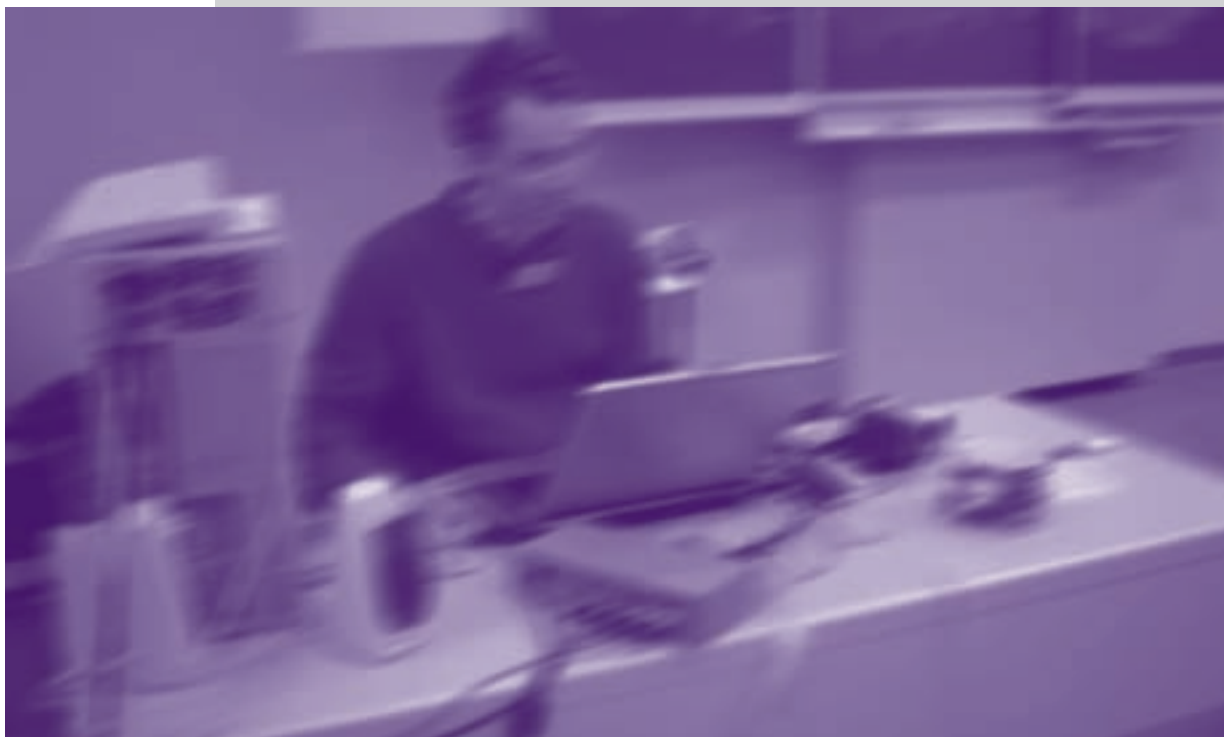
Mensen werken op computers met andermans account

Werk met veel plezier en werk vooral veilig.●