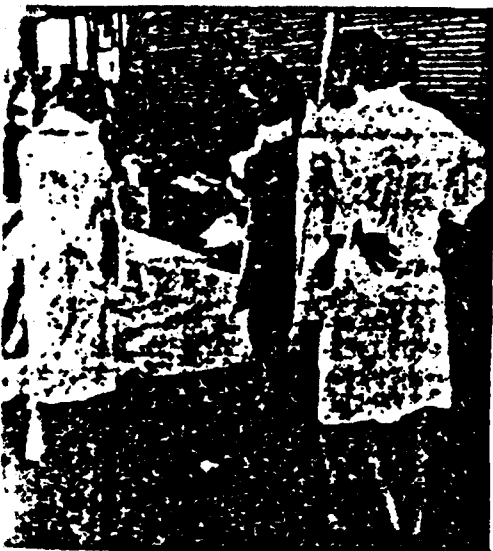
Over de oorlogsmisdadigers van toen en de... hun eigentijdse epigonen, zoals de... op het stationsgebouw van Bologna (foto) die...

V: Past ● VERKENNING: in het de sigarettenmarkt, de frigarns verschuivingen, de concurrentie, het rokersprobleem, de reclame - „Het gaat er primair om de keuze van jouw roker te verdedigen tegen sociale lectoren van buitenaf.“