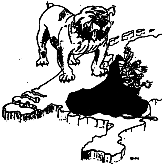
De BVD als waakhond van onze nationale belangen

Ook vanuit de samenleving, met name van vertegenwoordigers van overheid en bedrijfsleven, kwam de dringende vraag naar meer informatie en advies om zich te kunnen beschermen tegen deze en toekomstige acties. Aan deze vraag naar een produkt met een grotere voorspellende waarde kan de BVD in zijn nieuwe opzet nu beter voldoen.