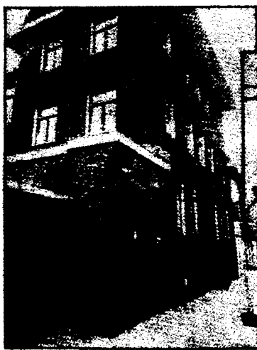
Het hoofdkwartier van de Speurgroep en AMOK in Utrecht. In het voorplan rechts.