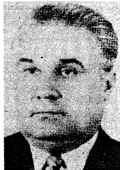
V.V. FEDORCHUK ..... de komende man

Volgens artikel 33 van de CPSU- statuten wordt echter het CC "..... in de door het (partij)congres vast- gestelde samenstelling gekozen" en "..... wordt de samenstelling ervan (d.w.z. wanneer die door welke reden dan ook is verstoord) uit de door het congres gekozen kandidaatleden van het Centraal Comité van de CPSU aangevuld. *) Strikte toepassing van die bepaling zou betekenen dat FEDORCHUK pas tijdens het volgende CPSU-congres, dat in 1986 moet worden gehouden, een plaats kan krijgen in dit hoge partijorgaan.