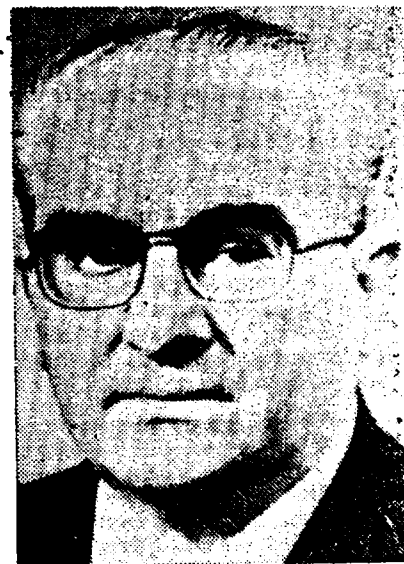
Y. ANDROPOW de gaande en .....