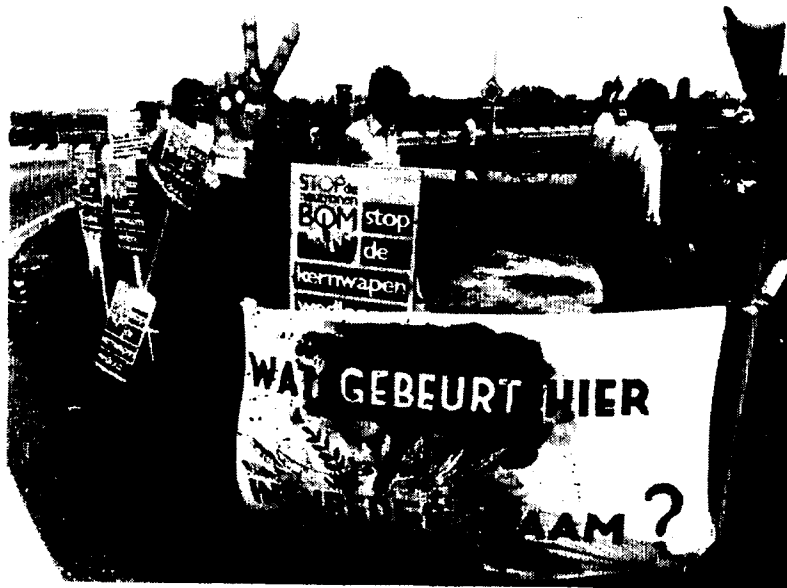
Demonstratie Noordwijkerhout.

Mogelijk ligt de oorzaak hiervan in het feit dat de aandacht verschoven is van de NAVO zelf naar de middelen (kernwapens) waarvan de NAVO zich bedient. (Een kleine demonstratie die wel plaatsvond was hierop gericht). Immers, het doel op langere termijn, vermindering van het weerstandsvermogen van de NAVO, lijkt door deze koerswijziging inhoudelijk niet aangetast.